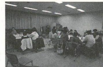
小出ボランティアセンター(魚沼市)

親子で運動遊びを楽しんだあとは、2名の語りべの方から、昔ばなしを聞き、交流会を行いました。