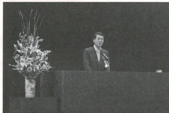
開会式 泉田県知事・篠田新潟市長・新潟県選出国会議員の方々など多数のご来賓よりご臨席賜りました。

大会と並行して、子どもプランも実施しました。大会・子どもプランの一部と感想をご紹介します。