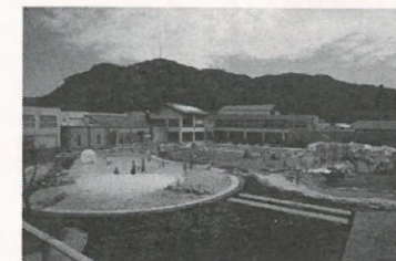
うみてらす名立(上越市)

「ミネラル健康水」の海水プールで健康づくりと心身をいやしたあとは、みんなで昼食のカレーを食べました。交流会では、生活・仕事など今困っていることをみんなで話し合いました。